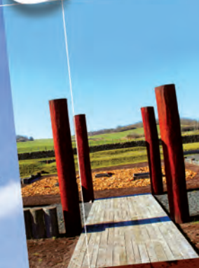
Corent, ville gauloise