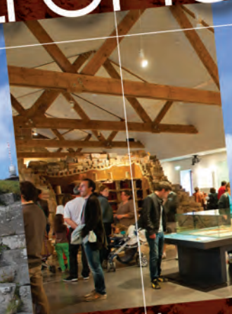
Lezoux, Musée départemental de la Céramique