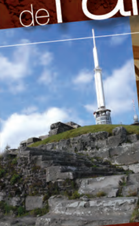
Temple de Mercure, sommets du puy de Dôme