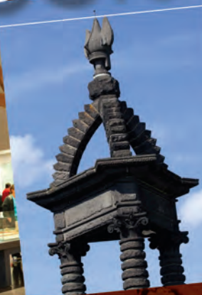
Plateau de Gergovie