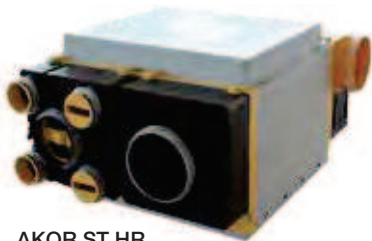
AKOR ST HR