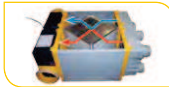
Croisement des flux d'airs à travers un échangeur à plaques