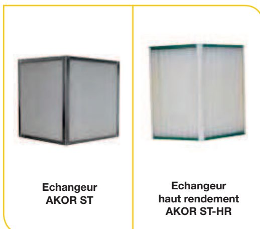
Echangeur AKOR ST