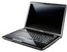
PC + programme