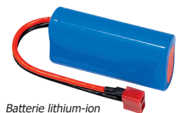
Batterie lithium-ion réf. 027411

En appui de la technologie Batteryless, la batterie lithium-ion (réf. 027411) intervient, à la demande, dans la précharge des supercondensateurs lorsqu'ils ne parviennent pas à utiliser la tension résiduelle de la batterie.