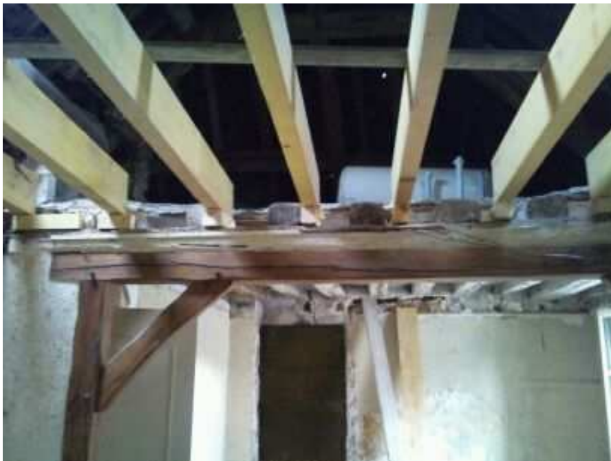
Photo prise le dos à la cheminée en regardant vers le garage