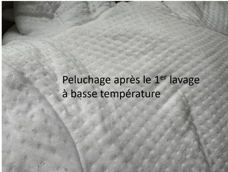
Peluchage après le 1 er lavage à basse température