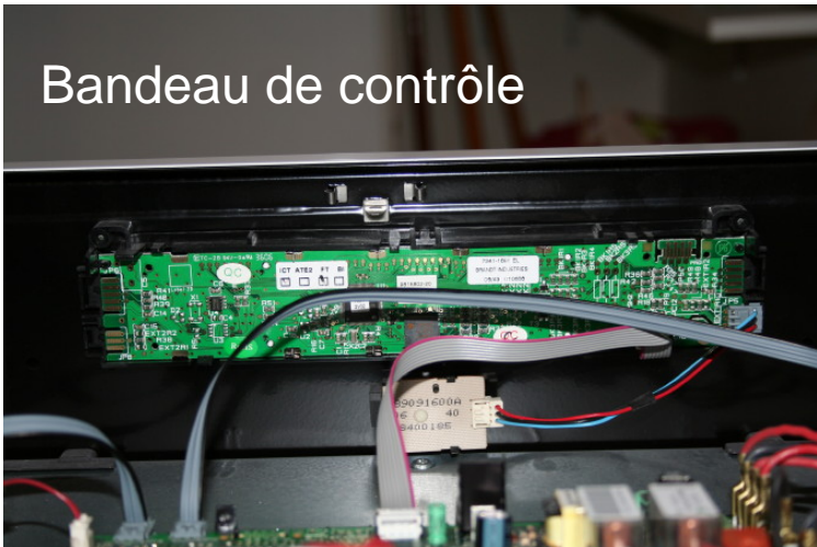
Bandeau de contrôle