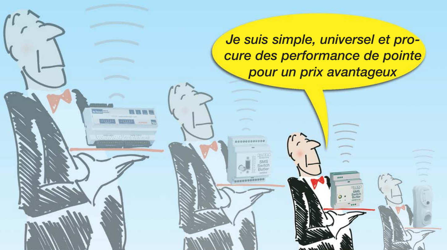
Internet Butler ic.1 6 canaux de commutation + entrées analogiques/numériques DR 6640.. / DR EIB..