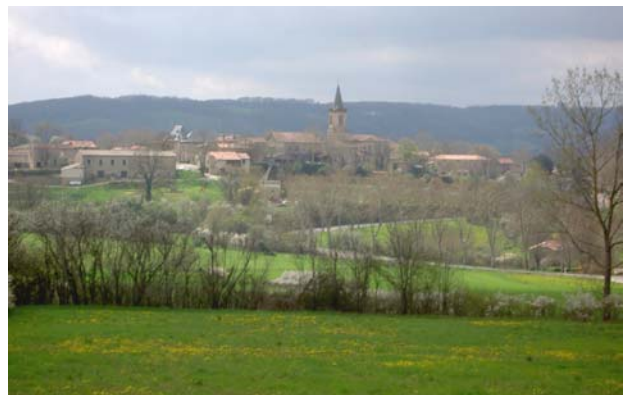
Village de Verfeil vu depuis l'éco hameau

- une démarche humaine : construire sur sa parcelle individuelle en s'insérant dans un territoire accueillant composé de hameaux.