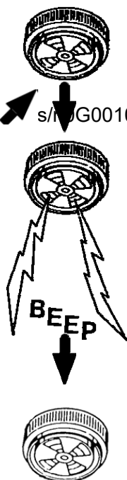
Faux- cornet intermittent possible